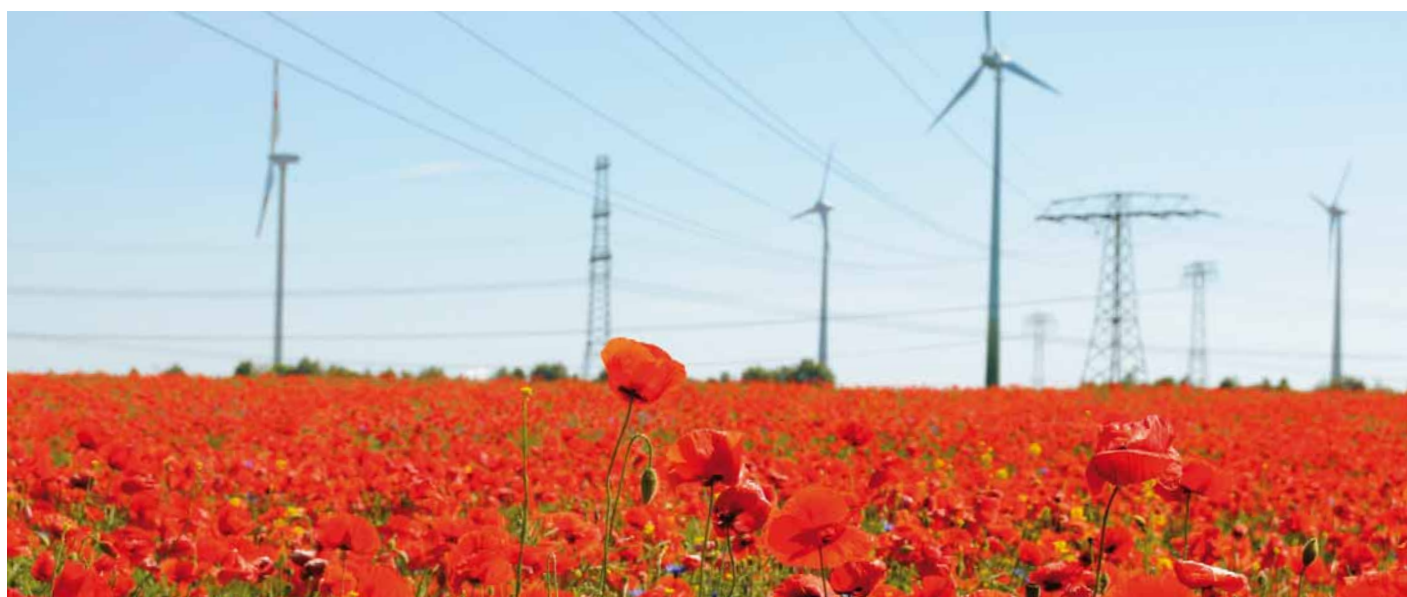
EEG-Einspeisungen führen nach dem neuen Wälzungsmechanismus zum Ausweis von Materialaufwand.

Sofern im Zeitpunkt der Abschlussaufstellung die Abgabemenge an Letztverbraucher bereits feststeht oder die entsprechende Meldung bereits an den ÜNB übermittelt wurde und sich hieraus für das EVU ein Mehraufwand ergibt, hat dieses eine sonstige Verbindlichkeit zu bilanzieren, da es sich seiner Verpflichtung nicht mehr entziehen kann und keine Unsicherheit der Höhe nach besteht.