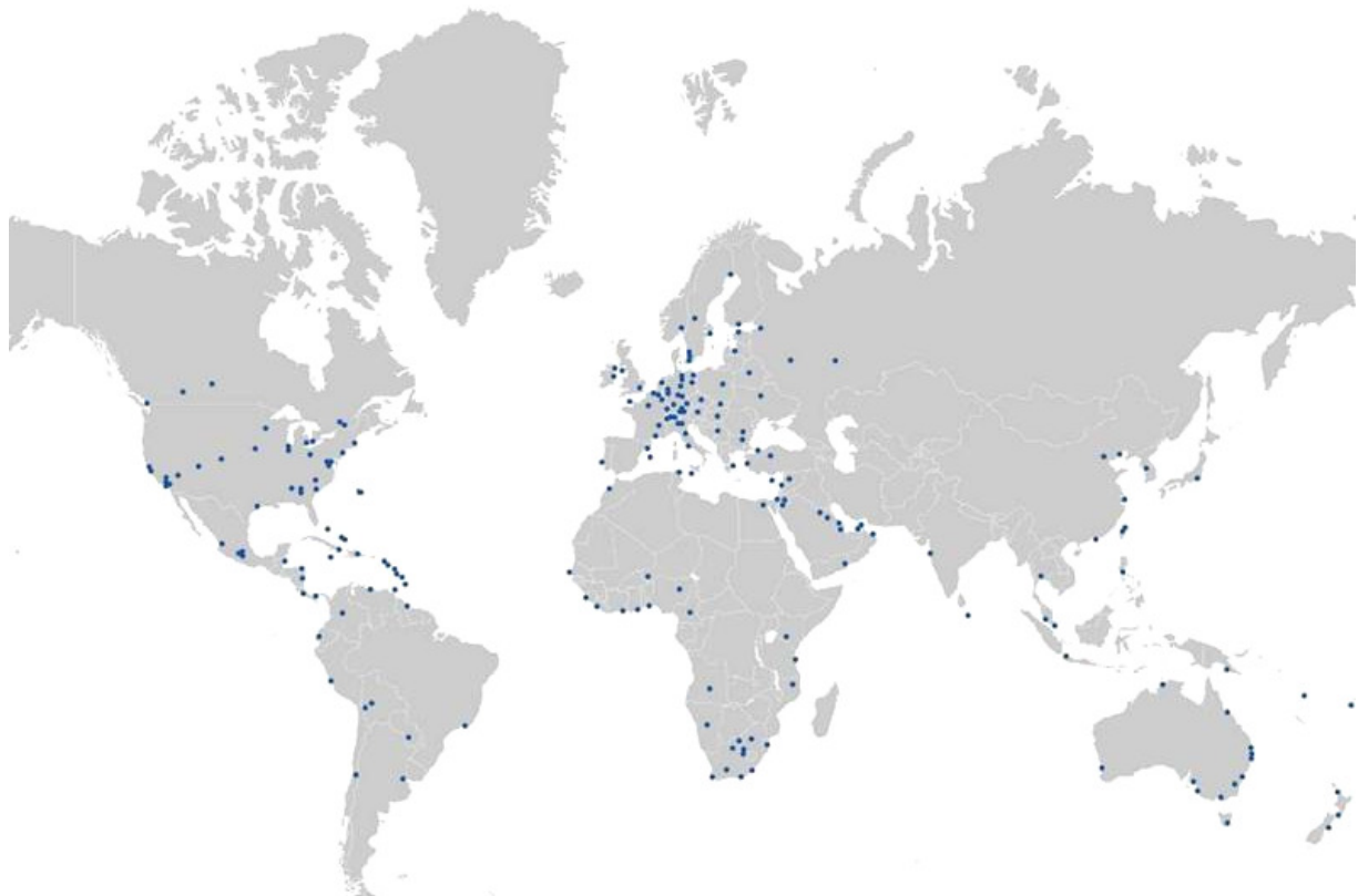
PKF Standorte weltweit

Über unsere PKF-Zentrale in London verfügen wir jederzeit über aktuelle Informationen und Arbeitsmittel zur Anwendung der International Standards on Auditing.