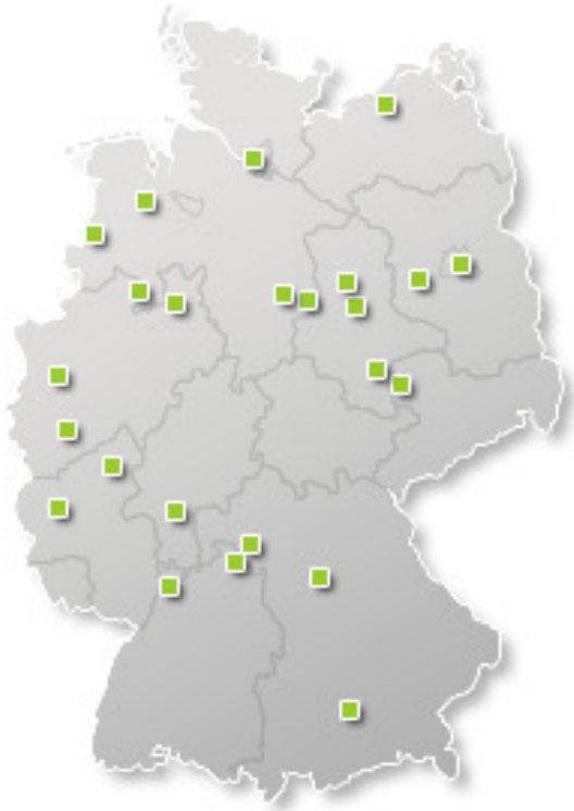
PKF Standorte Deutschland

Die PKF Deutschland GmbH ist am 2. Juni 1987 gegründet worden. Die Gesellschaft ist im Handelsregister unter der Nummer HR B 38381 beim Amtsgericht in Hamburg eingetragen und unterhält zum Berichtszeitpunkt berufsrechtliche Niederlassungen in